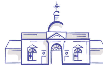
AREÁL NEMOCNICE V TOPOLČANOCH PROJEKT KEGA I 016STU - 4 / 2017

Dnes máme možnosť cestovať a poznávať ďalšie krajiny, ich kultúrne pamiatky, prírodné vzácnosti, ale i postoj k ich ochrane a zachovaniu. Cestovanie nás obohacuje, nielen o nové poznatky, ale vyvoláva aj otázky, ako sa zaujímame o svoje okolie, vážime si naše kultúrne a prírodné dedičstvo, uvedomujeme si jeho hodnotu, alebo ničíme všetko okolo a nechávame to napospas osudu?