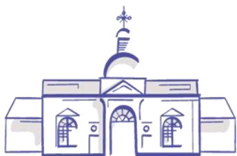
AREÁL NEMOCNICE V TOPOLČANOKH PROJEKT KEGA I 016STU-4/2017