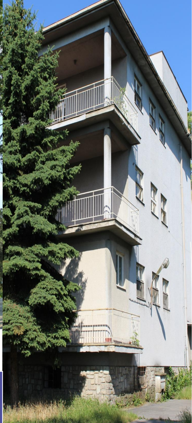
Pavilón infekčný a interný.