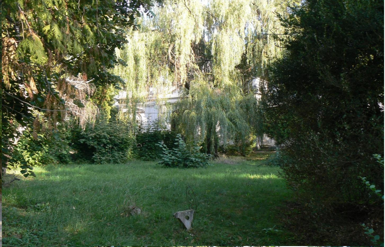
Zeleň v areáli „starej“ nemocnice.