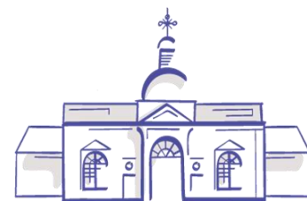
AREÁL NEMOCNICE V TOPOĽČANOCH PROJEKT KEGA I 016STU-4/2017

Vstupný objekt – pohľad do vnútornej čast, detail stropu a okna nad vchodom.