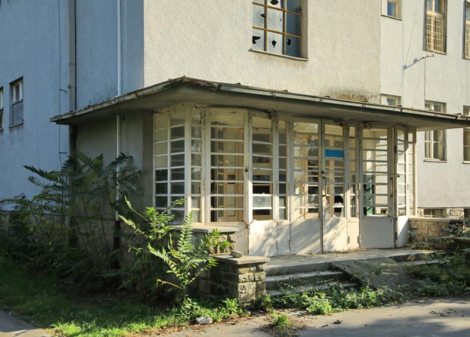
Pavilón postavený pre infekčné a interné oddelnie.