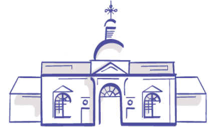
AREÁL NEMOCNICE V TOPOLČANOH PROJEKT KEGA I 016STU-4/2017

Je symbolické, že myšlienka realizovať projekt, vznikla v roku 130. výročia založenia „starej“ nemocnice v Topolčanoch, kedy sa v čase prelínajú rovnaké ciele vytvárať a zachovať hodnoty určené v prospech súčasných a budúcich generácií.