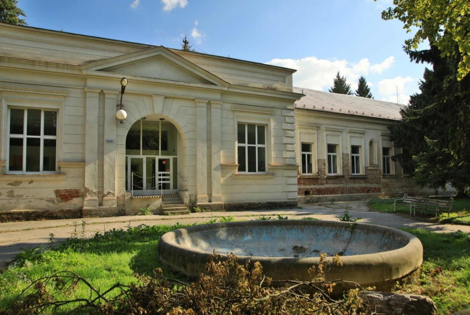
Hlavný pavilón v popredí nefunkčná fontána.