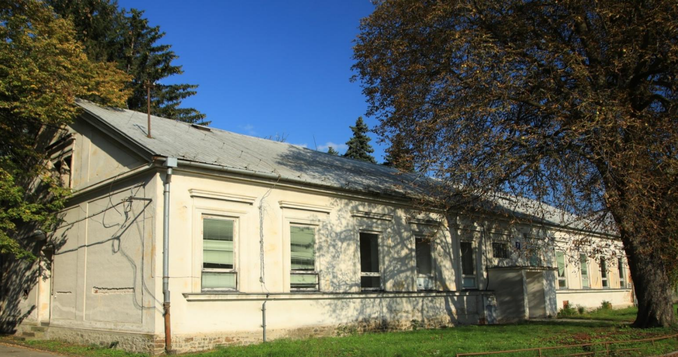
Pavilón patológie – detail schodišťa a dverí.