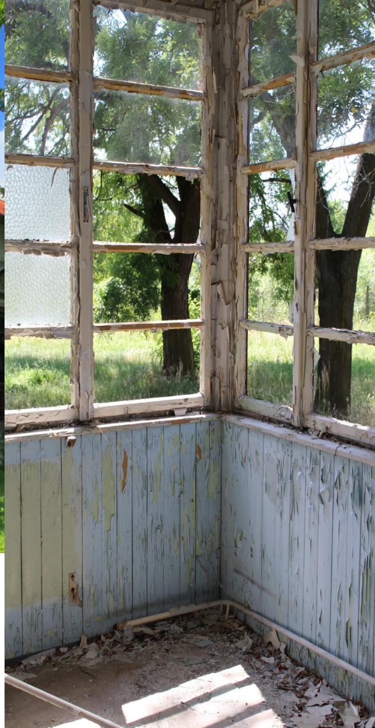
Detail časti interiéru infekčného pavilónu.