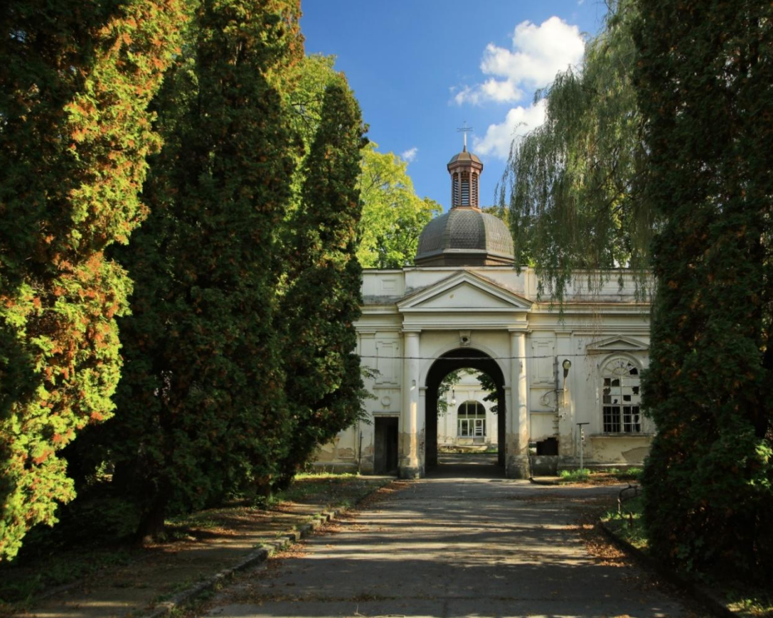
Vstupný objekt zo starny Stummerovej ulice a detail okna.