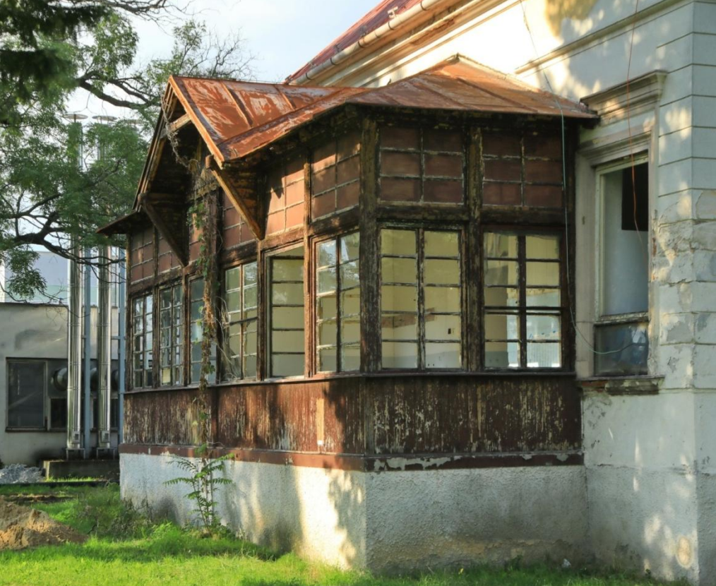
Detaily infekčného pavilónu, neskôr kožné oddelenie.